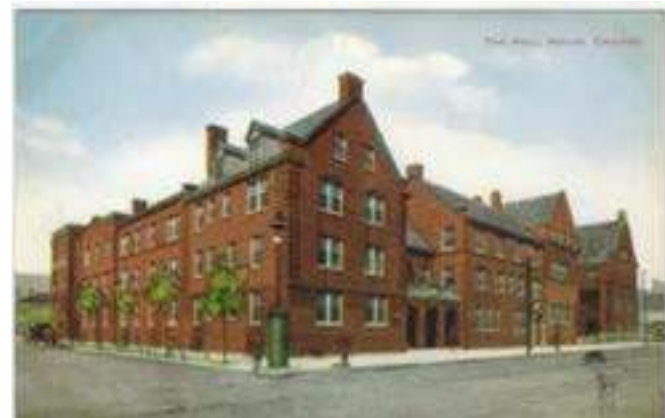
Hull House em Chicago no ano de 1889.