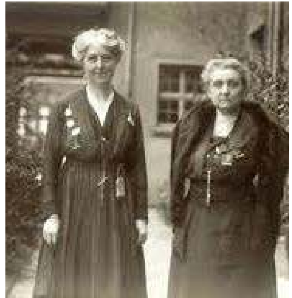
Mary Roset Smith e Jane Addams (30 anos de relacionamento homoafetivo entre o século XIX e o início do século XX).