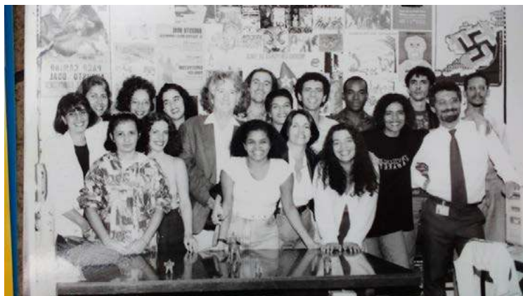
Imagem 3 – Equipe do Mandato Político-teatral com Augusto Boal ao centro.

a produção dos “santinhos” 11 (Imagem 2). No dia primeiro de janeiro de 1993, Boal e o CTO tomaram posse na Câmara Municipal do Rio de Janeiro e fizeram história com uma proposta inédita de mandato participativo e, pela primeira vez na história brasileira, coletivo (Imagem 3).