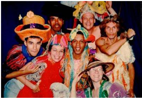
Imagem 7 – GHOTA no salão do 6º andar do Teatro Glaucete Rocha.

dia, atendendo ao apelo de homens e mulheres homossexuais que ali encontravam refúgio. Por muitas vezes em que estive no espaço, presenciei a acolhida e o abrigo em que se transformava a sede quando um dos participantes era ameaçado ou estava em situação de perigo. Alguns moravam na casa por semanas, pelo de fato de terem sido expulsos de seus próprios lares após assumirem sua orientação sexual ou por estarem sob ameaça. O medo se fazia presente a todo instante. Era real. Quase palpável. Todos os dias em que estive presente, ouvi histórias do massacre diário pelo qual passavam aqueles meninos e aquelas meninas. (SARAPECK, 2016, p.140).