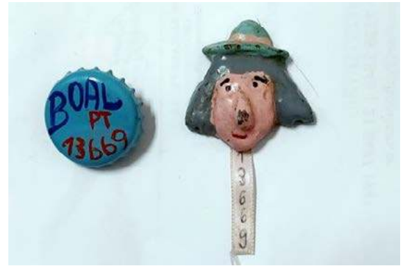
Imagem 1 – Buttons de tampinha e resina.

Na posição de aprendiz não percebia os caminhos que Boal traçava no desenvolvimento do