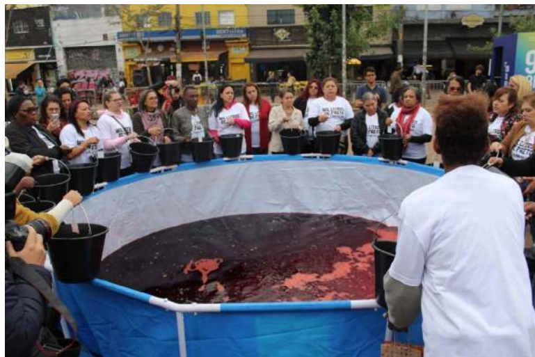
Imagens da performance instalação Mil Litros de Preto: O Largo Está Cheio na Mostra 3M de Arte.