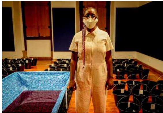
Imagens da performance instalação Mil Litros de Preto: A Maré Está Cheia no Festival Artes e Vertentes.

pectador compreende o espetáculo a partir do seu conhecimento de mundo, dessa forma o mesmo precisa confrontar a sua própria vida para ter uma reflexão crítica.